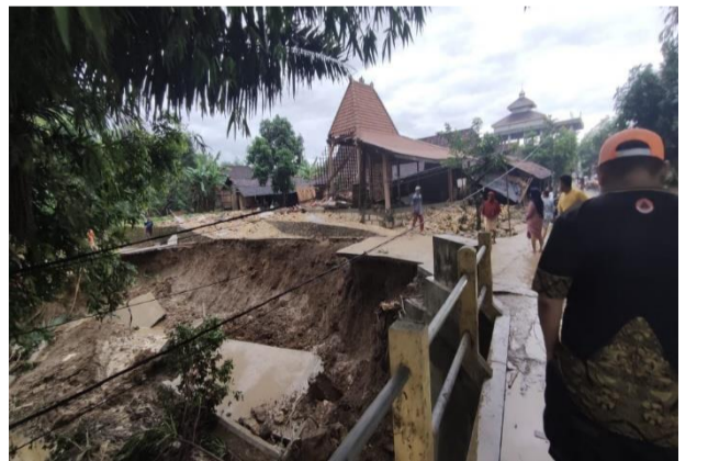
Area pemukiman Dusun Tamansari Desa Godo Kecamatan Winong