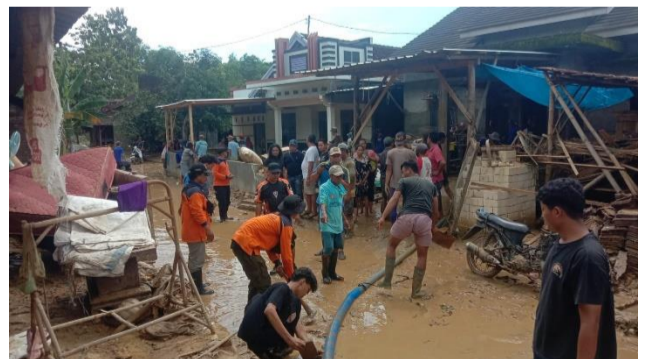
Giat pembersihan BPBD Kab.Jepara di lingkungan Dusun Tamansari Desa Godo Kec. Winong