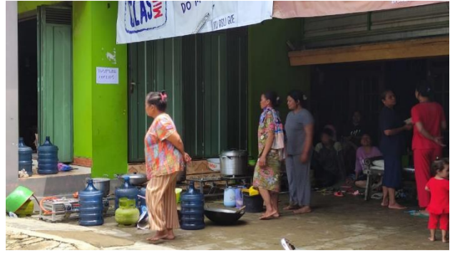
Dapur umum mandiri di Dusun Tamansari Desa Godo Kec. Winong