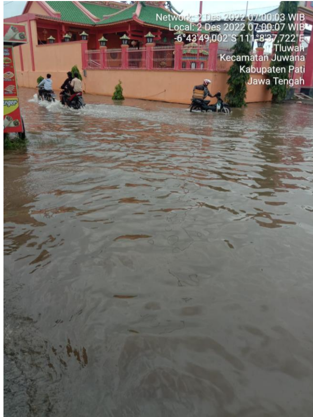
Kondisi Desa Tluwah Kec. Juwana